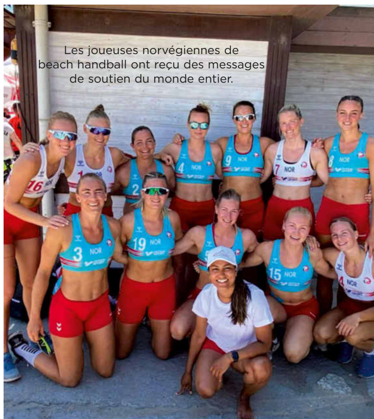
Les joueuses norvégiennes de beach handball ont reçu des messages de soutien du monde entier.

et trouvent que ce n'est pas confortable pour pratiquer leur sport. De plus, chez les hommes, le slip de bain n'est pas obligatoire : ils sont autorisés à jouer en short. Les joueuses réclament le droit d'en mettre un elles aussi. S. H.